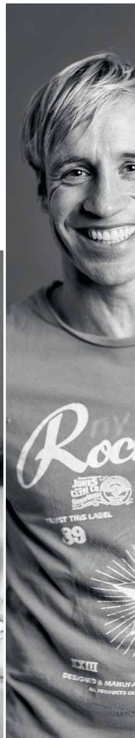
PIRMIR UMBRICHT WEIN & GEMÜSE UMBRICHT UNTERSIGGENTHAL | AG