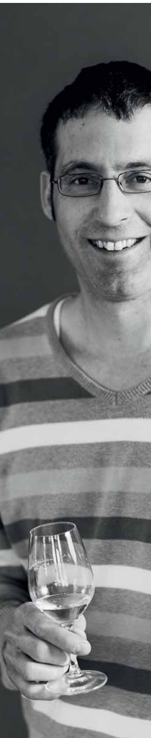
JÜRIG MARUGG WEINGUT IM POLNISCH, FLÄSCH | GR