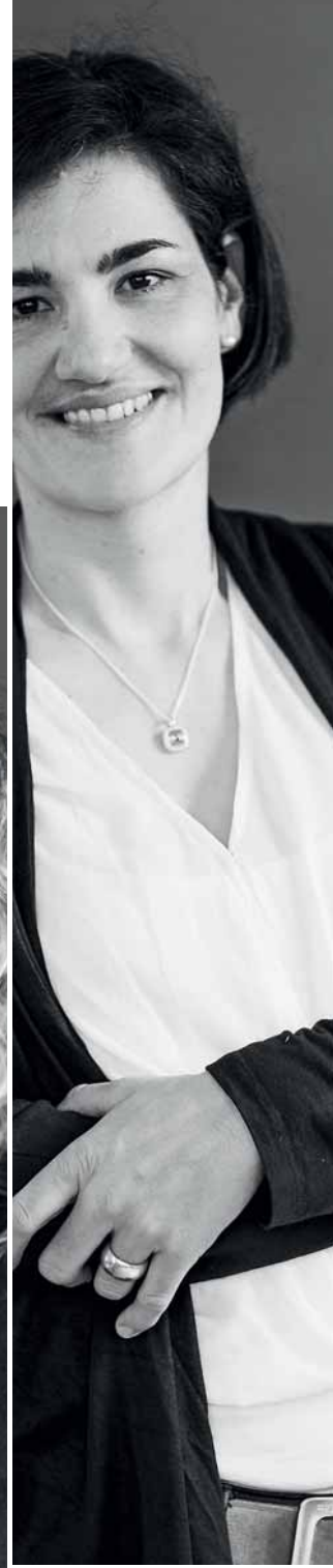
CARINA LIPP-KUNZ KUNZ-KELLER, MAIENFELD | GR