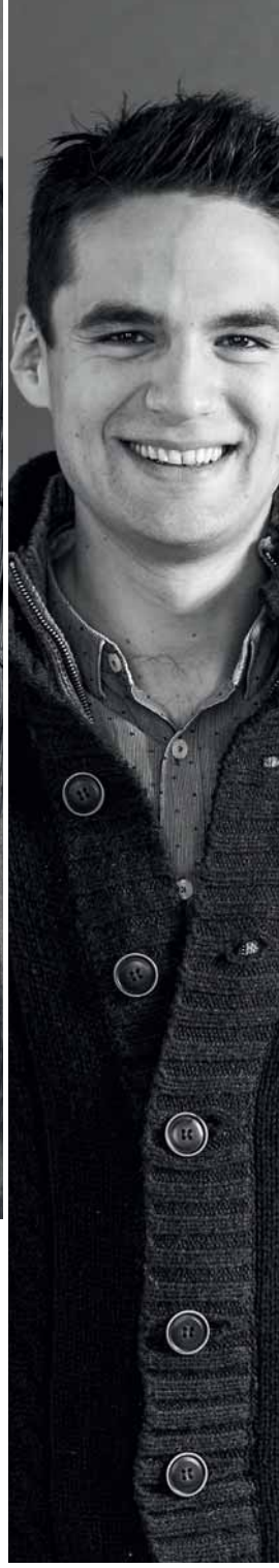
FABRICE SIMONET LE PETIT CHÂTEAU, MÔTIER | FR